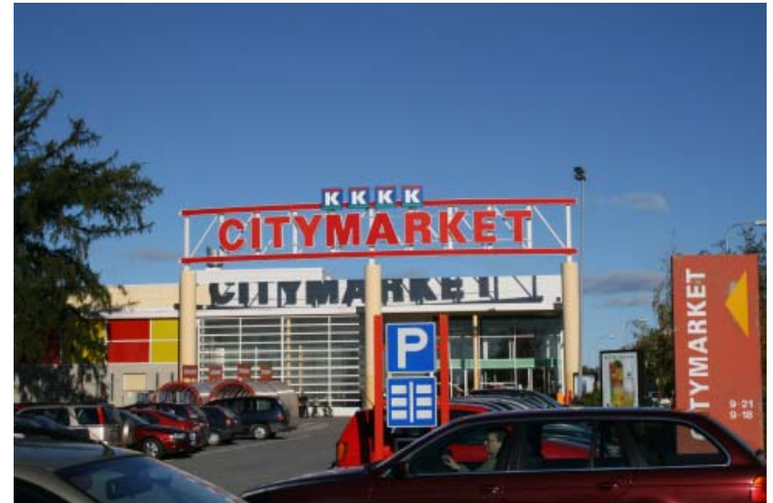
Kuopio, Vasa eller Jakobstad

På en plats måste man kunna orientera sig geografiskt och historiskt. En äkta plats är sådan att jag kan lokalisera mig genom tex olika landmärken. Det kan också vara för området specifik sten som används i byggnader eller gator och vägar.