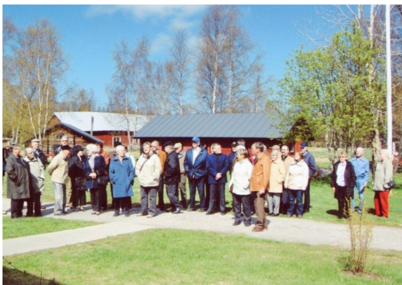
Släkt- och bygdeforskare från föreningarna i Jakobstad och Nykarleby på utflykt till Bjärgas i Larsmo 2008.

Hjärtat i föreningens verksamhet är dess arkiv- och forskningsutrymme, sedan 1957 beläget i källaren på Pinnonäsgatan 28, men förstorat i ett par omgångar. Att utrymmet varit beläget på samma plats i 55 år har i detta fall både för och nackdelar. Arkivadressen är närmast ett begrepp i regionen, men det är även ofrånkomligt att de av föreningen hyrda utrymmena är opraktiska och allt för små för det material som föreningen samlat på sig. Verksamhetsutrymmet har behandlats många gånger under de gångna tio åren och styrelsen har undersökt olika nya alternativ. Största intresset rönste Rosenlunds prästgård, från vilken Pedersöre församling flyttade bort år 2007. Under åren 2006-2007 sonderade föreningen möjligheten att hyra in sig i en del av prästgården, men det ledde inte till resultat.